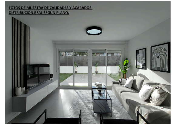
FOTOS DE MUESTRA DE CALIDADES Y ACABADOS. DISTRIBUCIÓN REAL SEGÚN PLANO.